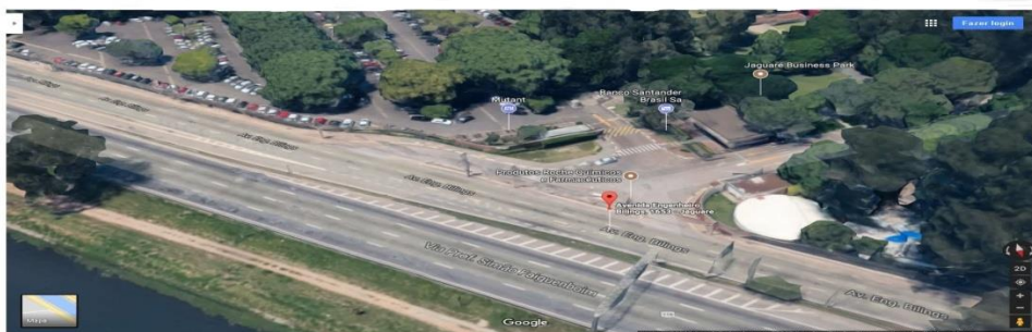
Mapa Panorâmico da NÃO localização da empresa.

Praça da Sé, 399 - Sala 402 - CEP 01.001-000 – São Paulo – Capital – F.:(11) 3228-4272 e (11) 3104-5730 Website: http://faccioadministracoes.com.br e-mail contato@faccioadministracoes.com.br