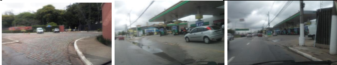
Posto Universitário CNPJ: 47.232.087/0001-96 Posto Universitário CNPJ: 47.232.087/0001-96