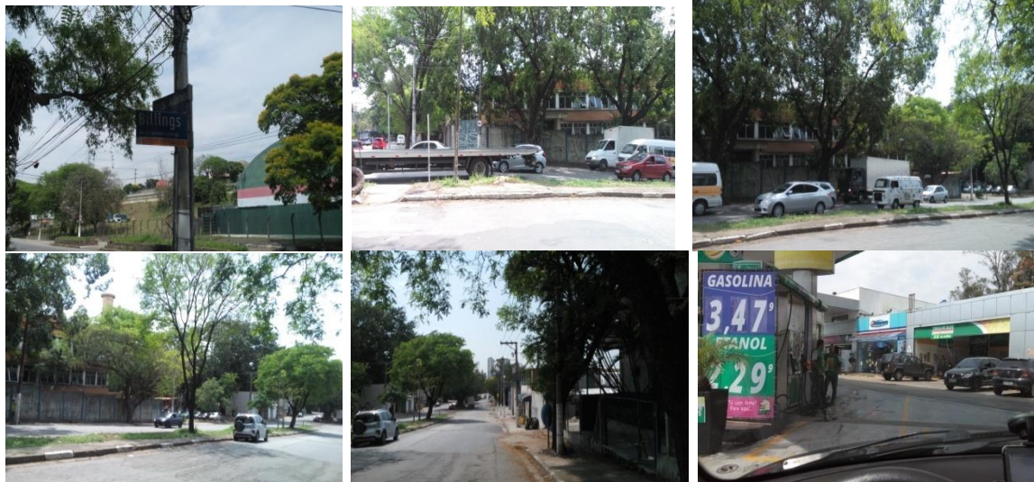
Posto Universitário CNPJ: 47.232.087/0001-96